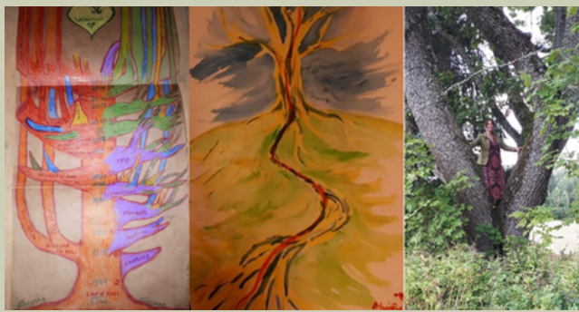
Usaldan puude tasast, ajatut tarkust. Tähendus loob mind.

Oma professionaalse maastiku kujutamisel kasutasin uurimiseks ja reflekteerimiseks küsimustega kõndimise meetodit ja puu metafoori. Need mõlemad on mulle andragoogika õpingute jooksul tähenduslikuks saanud ning mu professionaalse identiteediga tugevalt seotud. Katsetasin ülesandele lähenemist ka maastiku ja taevakehade metafooride kaudu, ent need ei kõlanud kokku mu meelesisundi ja aegruumiga. Nii otsustasin lubada endal püsida tuttavate teetähiste juures ning võtta oma professionaalse maastiku uurimisel sel korral inspireerivaks vaatenurgaks dialoogilise mina raamistiku